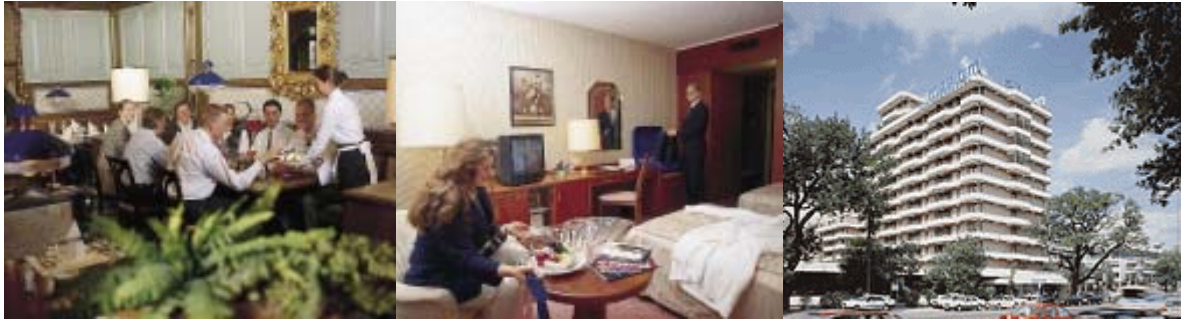
at Maritim Konferenzhotel Darmstadt