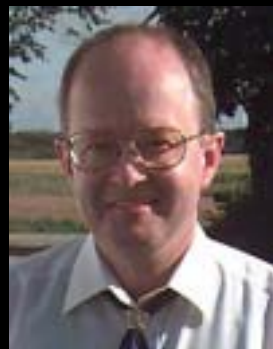
af Jan Wigh Nielsen

I denne artikel vil jeg bruge betegnelserne "niveau" og "program" lidt i flæng, selv om der vistnok er nogle, der mener, at det er mere korrekt at omtale Mainstream, Plus osv. som "programmer" end som "niveauer". Ordet "niveau" anvendes vistnok stadig af mange, og da jeg har set, at det bruges på DAASDC's arrangementsliste på nettet, vover jeg også at bruge det her.